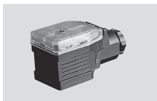
信号转换器 MUW ... , 一体化接头, 工作电压 24V, 标准信号输出